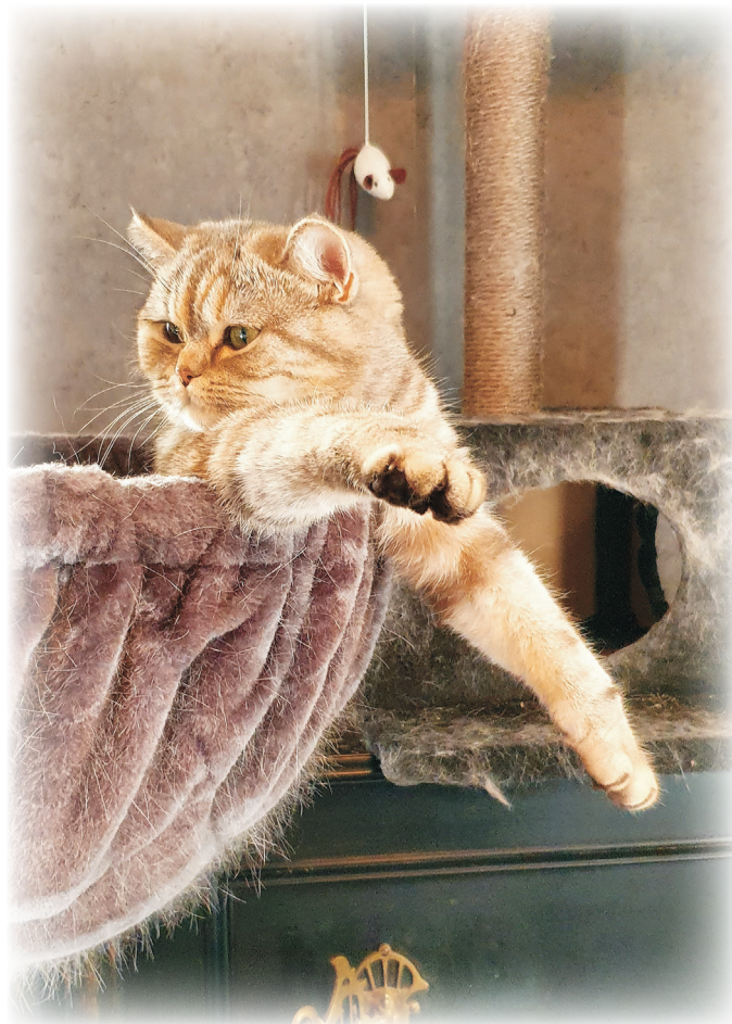
Pimkie - stressnivå noll