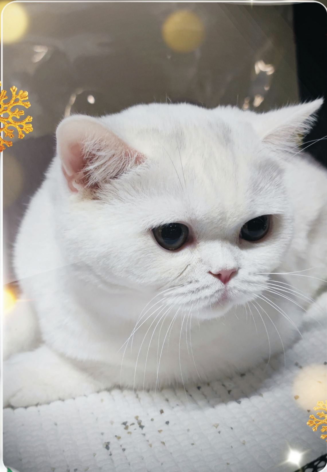
TAZZAMORE'S ICE FAIRY